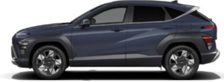
Denim Blue Pearl