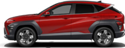
Ultimate Red Metallic