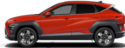
Soultronic Orange Pearl nicht verfügbar für Benzin und N Line