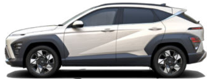
Serenity White Pearl nicht verfügbar für Hybrid